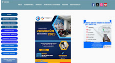
WhatsApp Image 2024-05-23 at 3.10.13 PM.jpeg 224K