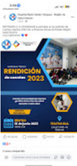
WhatsApp Image 2024-05-23 at 3.08.57 PM.jpeg 140K