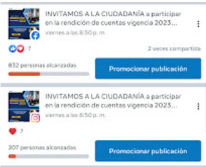
WhatsApp Image 2024-05-23 at 3.08.32 PM.jpeg 115K