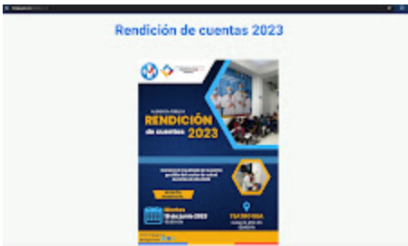
WhatsApp Image 2024-05-23 at 3.10.03 PM.jpeg 146K